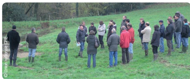
Visite d'exploitation, rencontres 2010