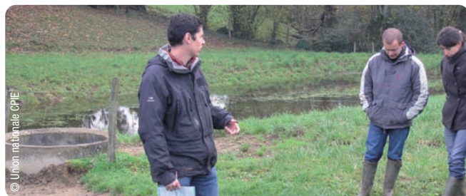
Visite d'exploitation, rencontres 2010

Aujourd'hui, les résultats positifs portent sur plusieurs aspects :