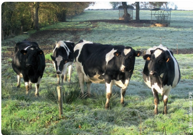
Visite d'exploitation, rencontres 2010

Une diminution de l'activité d'élevage peut entraîner une fermeture du milieu. Le site qui jouxte l'exploitation de M. Mériaux illustre ce phénomène.