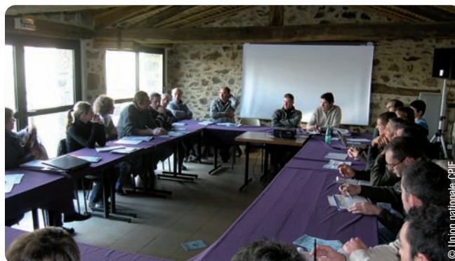
Temps d'échanges, rencontres 2010

Le territoire du pays de Pouzauges n'est à ce jour pas éligible au titre des mesures agro-environnementales territoriales . Ces mesures forment un dispositif qui s'applique sur des territoires précis, identifiés comme prioritaires pour la mise en œuvre d'une action visant à réduire les impacts de l'agriculture sur l'environnement, comme les zones humides. Son éligibilité et la