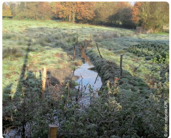
Visite d'exploitation, rencontres 2010

La mise en place de clôtures de protection qui suivent le cours d'eau permet de limiter l'accès à cette zone sensible. Les animaux ne peuvent accéder à ces points d'eau, le piétinement des milieux est limité : ainsi les risques de transmission de parasites est réduit et l'habitat d'espèces localement rares (par exemple la grenouille rousse) est préservé.