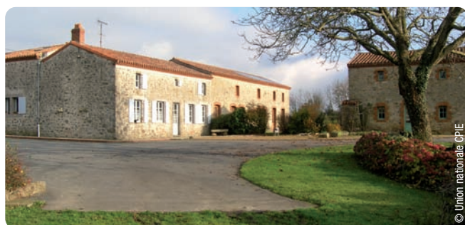
Visite d'exploitation, rencontres 2010

Le GAEC Le Granite est une exploitation familiale de 82 hectares. A son origine, il est essentiellement tourné vers l'élevage de vaches allaitantes, de taurillons et de culture maïs/blé/rgi (Ray-grass italien), avec une surface de 55ha. Les parents créent un bâtiment de volailles en 1985 pour l'installation du premier fils en GAEC. En 1995 s'installe le second fils avec la reprise d'une exploitation de 30 ha. La crise de la vache folle en 1997 oblige les exploitants à abandonner l'atelier de taurillons pour construire un second bâtiment volaille.